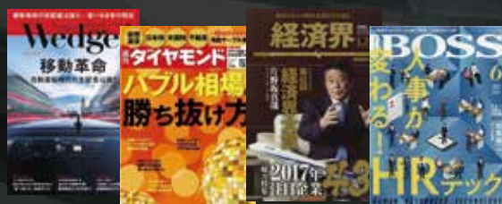
株式会社あしたのチーム掲載実績