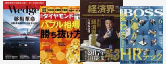
株式会社あしたのチーム掲載実績