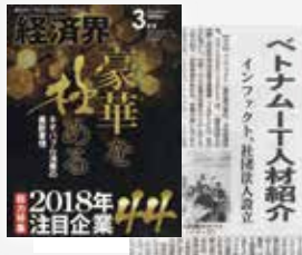
株式会社インファクト掲載実績